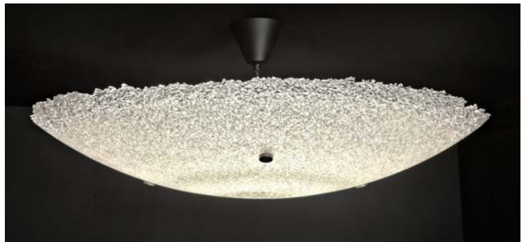
Sirua-valaisin 90 cm

Kierrätyslasin luonteesta ja valmistusmenetelmästä johtuen valaisimen pinnassa saattaa olla pieniä värieroja ja epätasaisuuksia.