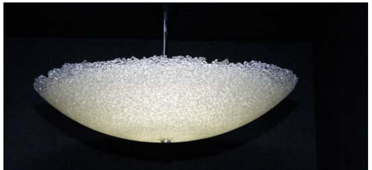
Sirua-valaisin 60 cm