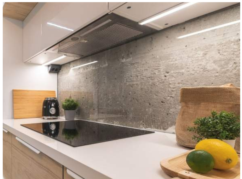
Kirkas lasi mattahopeat u-listat ympäri