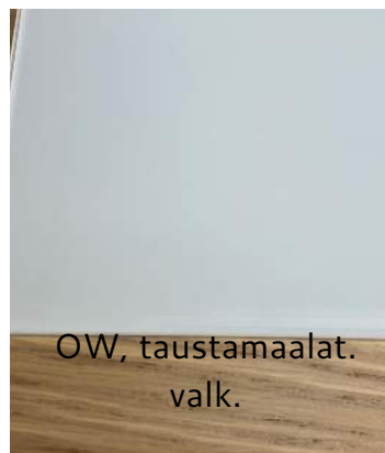
OW, taustamaalat. valk.