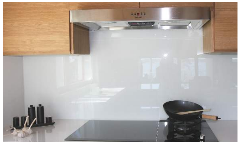
Taustamaalattu lasi, kiinnitys liimamassalla